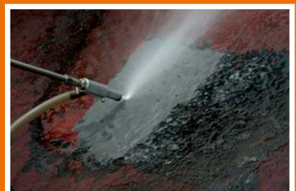
Strahlbild Wasser- Sandstrahlkit.