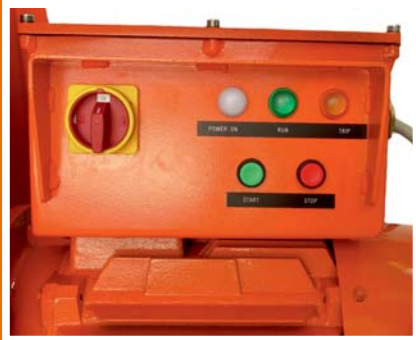
Druckguß Schaltkasten mit Hauptschalter und Überlastungsschutz.