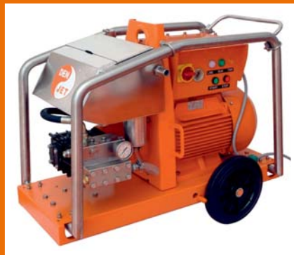
CE20 schmale Bauart.