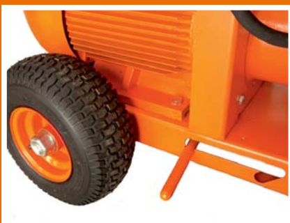
Feuerverzinktes Chassis mit Bremse und Luftreifen.