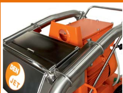
Zentrale Kranöse für einfache Verlastung.